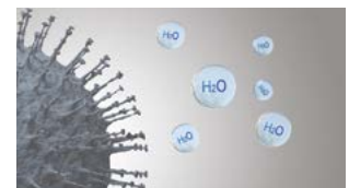
Forurenende stoffers aktivitet hæmmes.